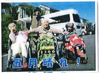
五月晴れ！ 絶好のお散歩日和♪

「晴雲秋月」とは...心に汚れがなく澄み透けている例え。「晴雲」は晴れた空に浮かぶ白雲、「秋月」は秋の澄んだ空にかかる雲の意。