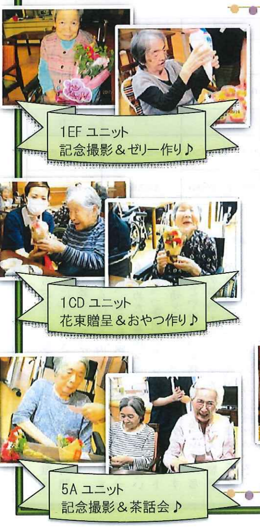
1EF ユニット 記念撮影&ゼリー作り♪

五月は母の日！ 女の比率では圧倒的に女性の入居者の方が多い秋月ですが、各ユニットで様々な「母の日」の催しが行われました。母の日当日には、ご本人宛にお花やカードが届いたり、ご面会に訪れるお客様も多く、プレゼントを誇らしげに眺めていらつしやる皆様のお姿が印象的です。 でした。ご家族と外食に出掛けられたり、ひ孫さんやペット等ご面会が絶えない方もおり、賑やかな輪の中でいつもと違う特別な一日を、それぞれ嬉しうに過ごされています。 秋月にいらつしやる皆さんの「母」たる皆様、いつも有難うございます！