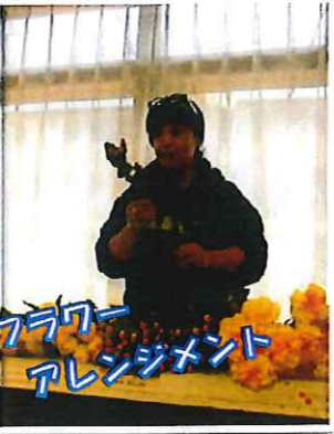
アキラ アレンジメント