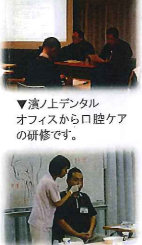
▼演習上デンタルオフィスから口腔ケアの研修です。

までは研修を受ける立場の職員が、皆に伝える立場に変わり研修を開催します。そのため、時間を設けて説明する文書をまとめ、資料を作成し印刷するなどの準備をしています。準備も研修の一環としては有効で、色々な資料を確認し、どのように話したら各々の職員に伝