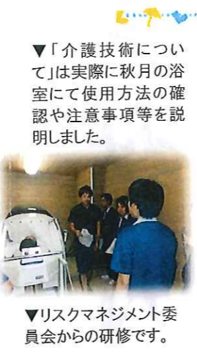
▼リスクマネジメント委員会からの研修です。