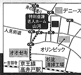
京王井の頭線 高井戸駅より徒歩7分

社会福祉法人 さわらび会 HP http://www.sawarabikai.or.jp/